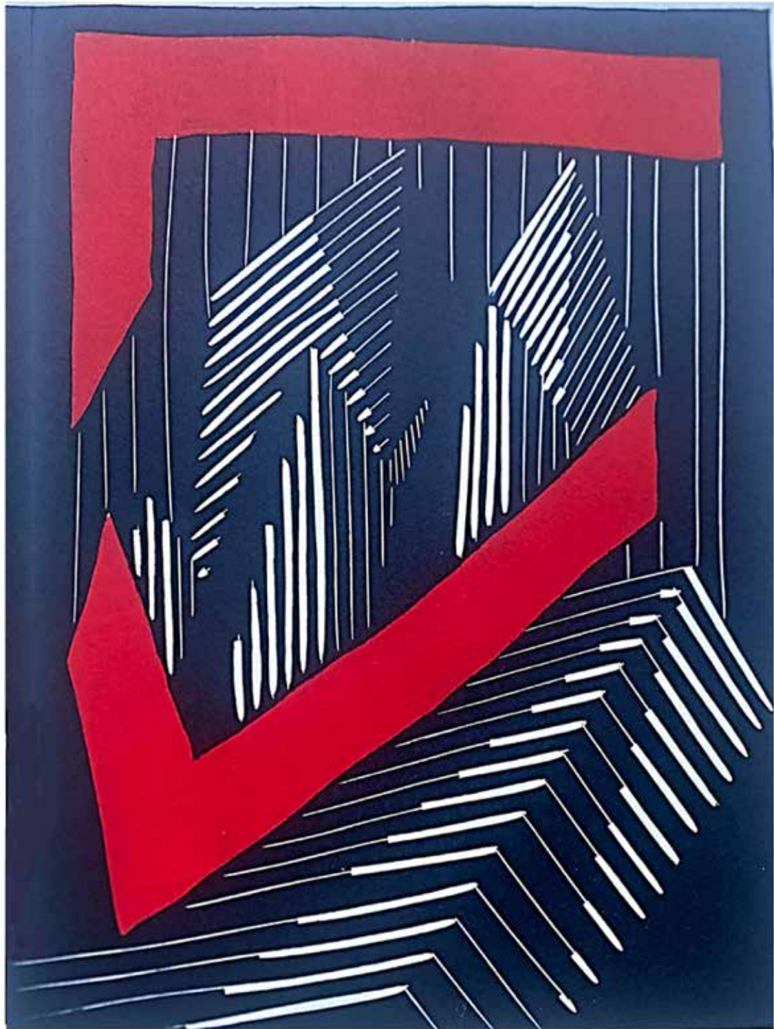
A.O. 3/4 нунорез "Сиратинка" Мовалт 2023.