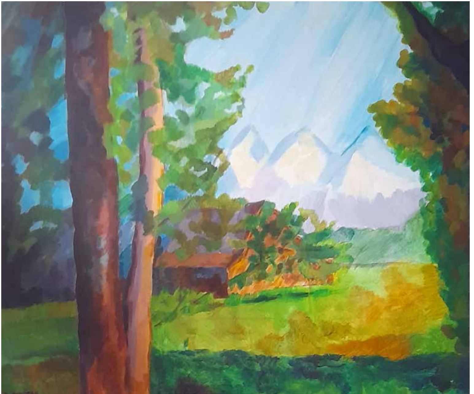
Idilična narava, 2024, akril na platnu, 80 × 100 cm